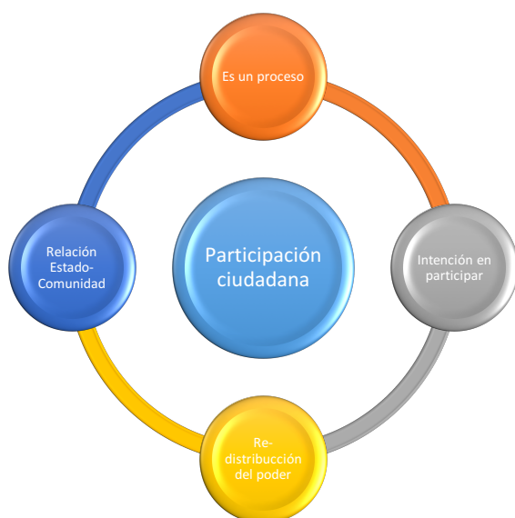
Figura 2. Principales características de la participación ciudadana

De forma resumida se puede entender la participación ciudadana como “todas aquellas prácticas políticas y sociales a través de las cuales la ciudadanía pretende incidir sobre alguna dimensión de aquello que es público” (Parés, 2009, p. 17). En esta primera aproximación se puede entrever la primera característica de este concepto: relación concreta entre la ciudadanía y los servicios del estado, donde se reflexiona y construye la idea de lo público (Álvarez, 1997; Ziccardi, 1998; Cunill Grau, 2008, Rodríguez Ponce y Pedraja Rejas, 2009; Oraisón, 2011).