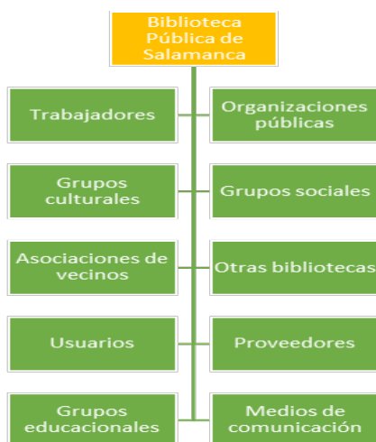
Figura 3. Categorías de stakeholders de la Biblioteca Pública de Salamanca

teriormente fueron categorizados en las siguientes 10 categorías (figura 3).